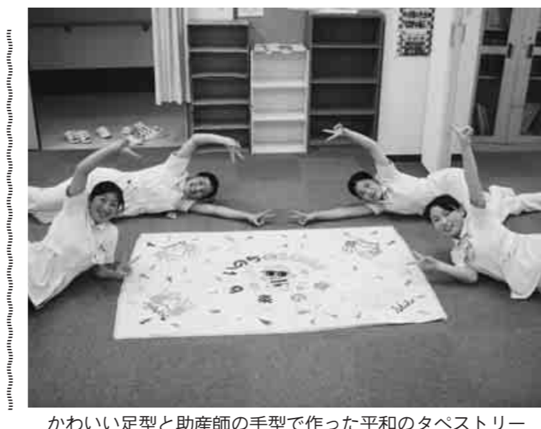
かわいい足型と助産師の手型で作った平和のタペストリー