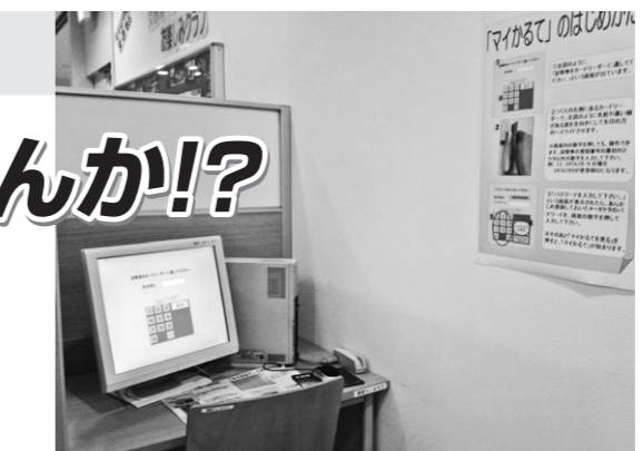
マイかるて閲覧コンピュータ

私たちは、患者様と医療者が協力して納得できる医療を実現するためには、必要な情報が適切に記載され、共有することが大事だと考えています。患者の権利章典における、患者様の権利と責任をより一層進め、医療者と患者のコミュニケーションを進めるツールとして、多くの方に利用していただきたいと考えています。