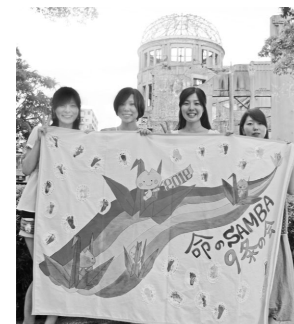
原爆ドームの前でタペストリーを掲げる参加職員