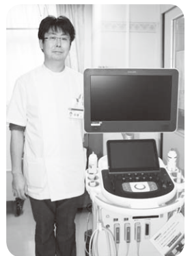
超音波診断装置 (小児科)

当院は埼玉県がん診療指定病院、救急告示病院として、高度な医療機器の整備と専門性の高いスタッフの育成はもちろんのこと、患者様の療養環境の整備にも取り組んでまいりました。