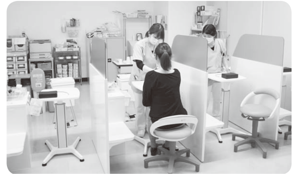
明るくなった採血室