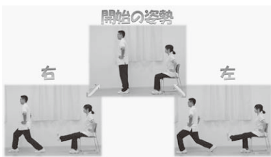
例)筋力トレーニング

いつでもどこでも、器具を購入しなくても、公民館(場所)を借りる必要もなく公園などでも気軽に体操ができます。高齢者(70代～90歳代)の方でも安全にできるように、運動時間を30分以内にした「いつでもどこでも体操」ができました。