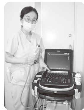
超音波診断装置 (ペインクリニック)