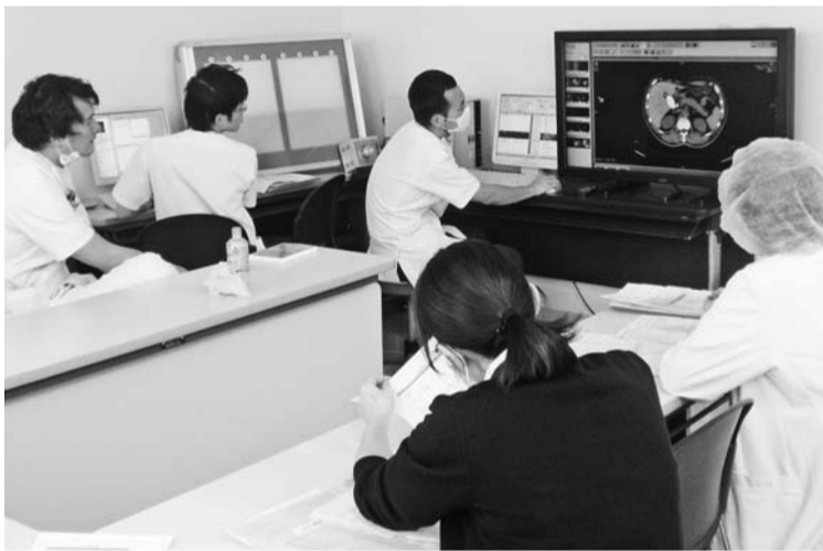
術前検討会のひとコマ