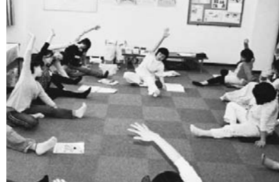
マタニティーヨーガ