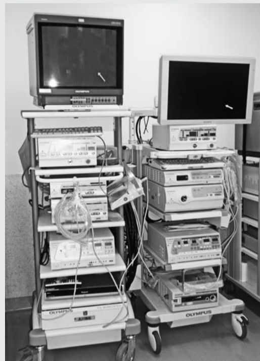
手術に必要な高額機器