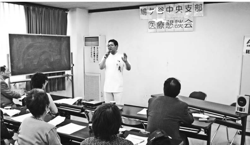
鳩ヶ谷中央支部の様子