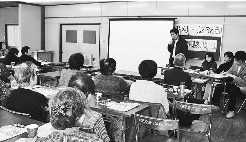
伊刈・芝支部の様子