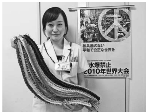
ボランティア活動の皆さんが千羽鶴を折ってくれました

「ニューヨークから広島へ」。5月のNPTに参加した代表3人の感動と元気を、リレーのよ