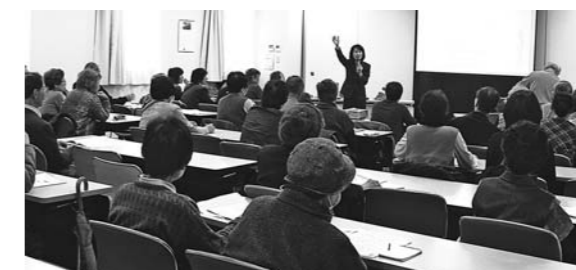
昨年度の講義風景

※講義内容は、2010年3月6日に開催された「第1回肝臓病教室」と同様の内容になります。