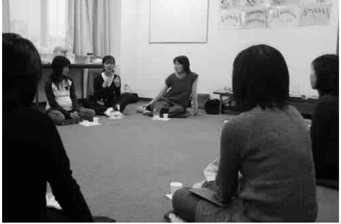
マタニティヨーガの様子