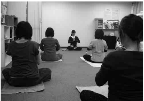
マタニティヨーガの様子

場所：産婦人科外来、多目的ルーム 費用：1回につき 1000円 申し込み：妊婦健診時、助産師にお申し出ください。