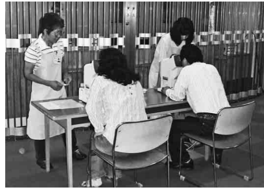
視力検査のお手伝いの様子

ザイ治療、爪矯正、ヒアス、ピーリング、男性型脱毛の希望の方はぜひご利用ください。