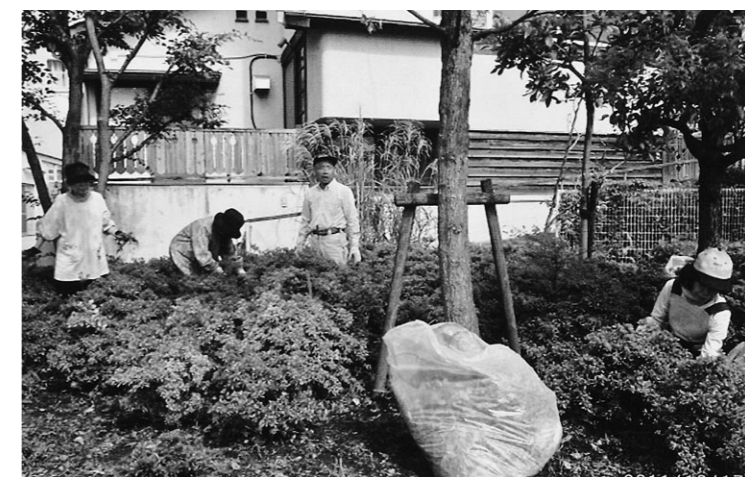
ボランティアによる剪定・除草作業