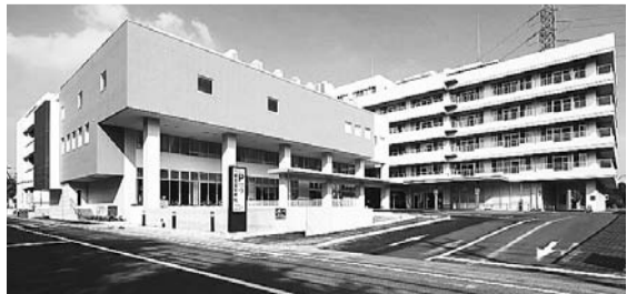
埼玉協同病院の正面玄関