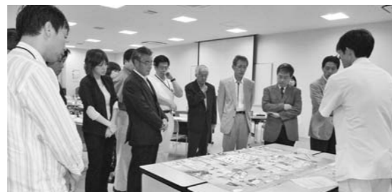
すころくを利用した学習教材の説明を聞く開業医の先生方

川口市では、糖尿病治療において地域連携を促進させるための会議も開催されており、当院での取り組みがその一端を担えるようになればと感じました。また、昨年来内科外来の再編で患者様を地域の開業医の先生方へご紹介させていただいており、その報告と意見交換を行うことで、お互いに患者様を安心して紹介できるような「顔の見える連携」を密にし「病診連携」を深められる懇談会になりました。