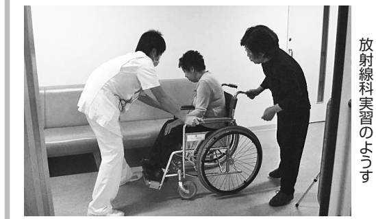
放射線科実習のちゅうす

当院のSP(模擬患者simulated patientの略称)活動について紹介します。職員が模擬患者様と日常の診療場面から想定したシナリオにそって対応の練習をします。職員が、適切な話し方や態度について考え、身につけるための実践的な学習の機会になります。