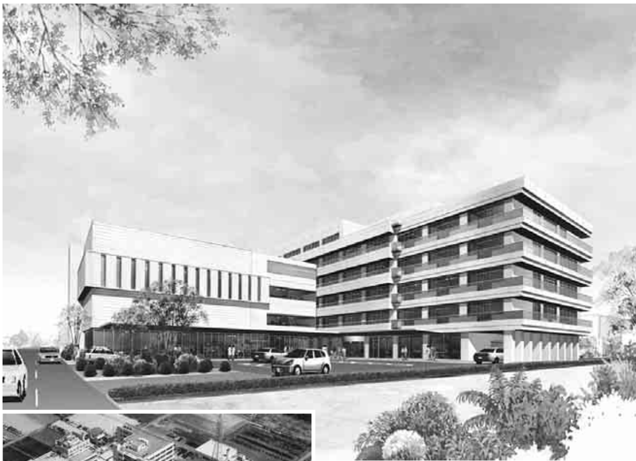
新診療棟予想図（完成後の建物とは異なります）