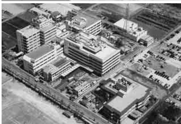
現在の埼玉協同病院