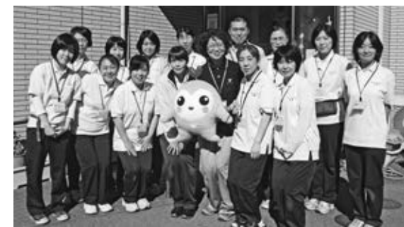
ケアセンターかがやきの職員

ケアセンターかがやきはいわゆる診療所のすぐ隣にあります。訪問看護、訪問介護、通所介護、居宅介護支援の4事業を運営しており、70数名の職員が利