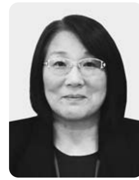
日本臨床検査医学会認定臨床検査専門医・日本輸血細胞治療学会認定輸血専門医・ICD制度協議会認定インフェクションコントロールドクター

退職する時に、「あ〜、うるさいババアがいなくなって清々した！」と喜ばれ、しかし、数日後には「いないと不便だな〜」と偲んでもらえる…そんな検査医になったらいいかなと思う今日この頃です。