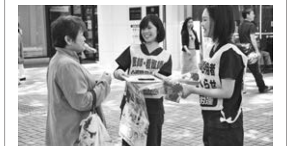
春のナースウェーブ行動

ナースウェーブ行動では、看護師を増やすための「増員署名」に取り組みます。看護師不足の実態を地域住民の皆さんにも伝え、「看護師ふやして」と訴える私たちの思いへの賛同を広げます。