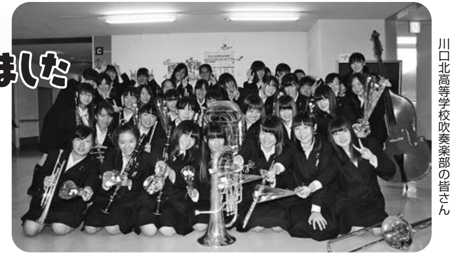
川口北高等学校吹奏楽部の皆さん

当日は入院患者様を中心に約100名を超える参加で、なじみのある楽曲や社会現象となった「アナと雪の女王」、AKB48の「恋するフォーチュンクッキー」などの演奏に参加者の表情に