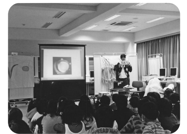
子どもたちは真剣なまなざしで授業を聞いてくれました