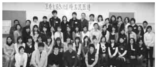
協同病院の新入職員50名

リハビリテーション科には、私を含めて理学療法士3名、作業療法士2名、言語聴覚士1名がこの4月より入職いたしました。学びたいこと、学ぶべきことは