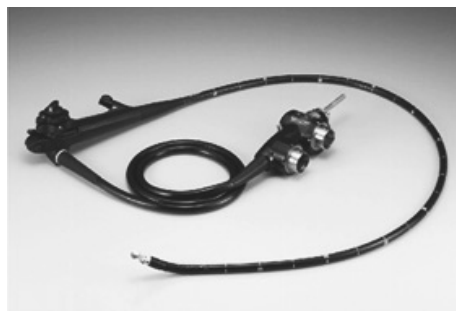
超音波内視鏡全景（左）、スコープ先端部と穿刺針（右）

膵・胆道疾患の早期発見や胃・食道がんの浸潤度合の診断サポートを目的にしてつくられたもので、消化管の中からなら360度の