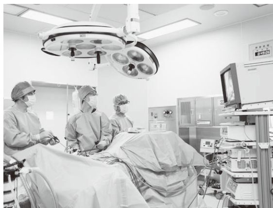
腹腔鏡手術のようす

組合員の皆様からお預かりした出資金は、新たな医療機器の購入や施設の拡充など、日々の診療の充実のために役立てさせていただいており、今年度は腹腔鏡手術システムを導入する運びとなりました。