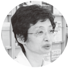
芳賀医師 (産婦人科)