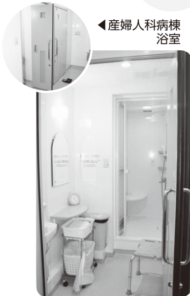
◀産婦人科病棟浴室

みなさまの出資金は今回の改修工事・機器の購入にも活かしています。ぜひ増資にご協力をお願いいたします。これからも急性期病院としての役割を発揮できるように地域のみなさまと共にすすんでいきたいと思っております。