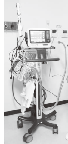
搬送用人工呼吸器