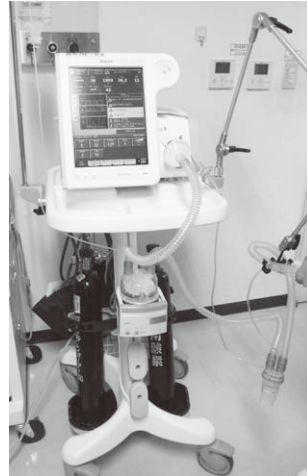
マスク式人工呼吸器

当院は今年で開院40周年を迎えました。皆さまのご協力により、今年度は医療機器の更新だけでなく根岸・道合・神戸を通る新しいバスコースも導入することができました。これからも急性期病院としての役割を發揮できるように年末増資への御協力をよろしくお願いたします。