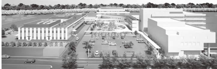
掲載CGIは計画段階のものであり、施工上等の理由により変更になる場合があります。