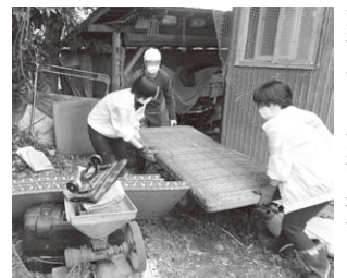
東松山市での支援の様子

2019年10月26日坂戸市社会福祉協議会からの依頼に基づき支援活動 に参加してきました。支援に行った先は、河川の決壊により人の背丈よ り高い位置まで水没した工場でした。事務所が併設されており、冷蔵庫や複合機など 使えなくなってしまったとの事です。工場の再稼働向け泥にまみれた部品の搬出と 選別、洗浄を行って来ました。微力ではありましたが再稼働への一助となれば幸いです。