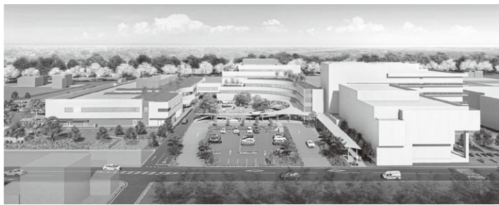
掲載CGは計画段階のものであり、施工上等の理由により変更となる場合があります。提供：竹中工務店

組合員や地域の方々により新病院を知ってもらうために12月4日(土)に建設まつりを開催いたします。