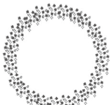
世界糖尿病デーシンボルマーク「ブルーサークル」オリジナル作

今年度は当院健康らいぶらりにて、「糖尿病イベント2021～HbA1cってなあに～」をテーマに2021年11月10日(水)～16日(火)に看護師・管理栄養士・薬剤師・臨床検査技師・理学療法士・歯科衛生士などのポスター掲示を行います。