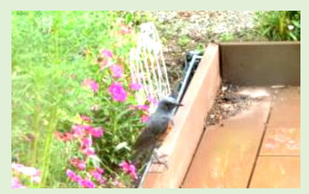
今年も渡り鳥がきました。時々、四十雀、ヒヨドリ、ツバメみられます

緩和ケアで働く全職種にアンケートを実施し圧倒的に埼玉が多い結果となりましたが、様々な出身のスタッフいるという発見もありました。今後は、住みたい県も聞いてみたいです。