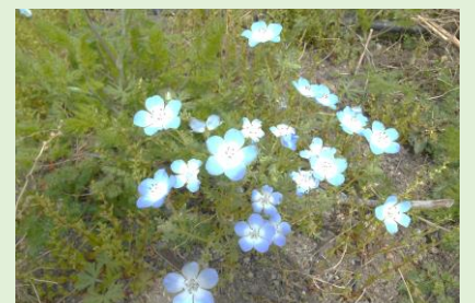
テラスも春の花で色づいてきています。