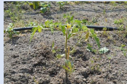
きゅうり、トマト、ピーマン、ナスも生育中