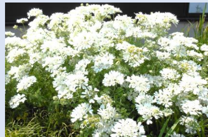
紫陽花やレースフラワーが見頃をむかえています